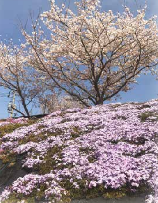
コミュニティセンター周辺