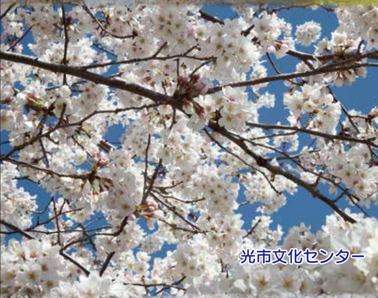
光市文化センター