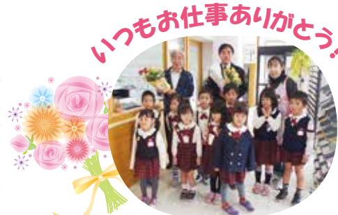
♥ステキなお花のプレゼント♥