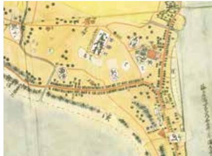
室積村地下図(山口市文書館蔵)