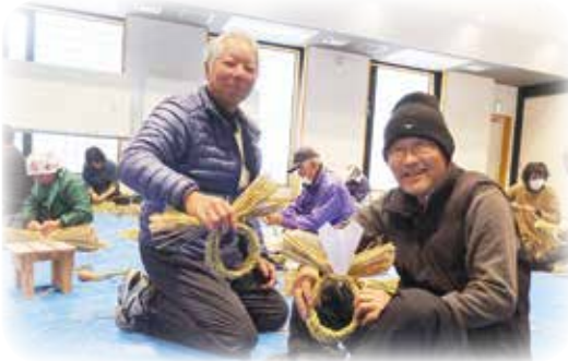
こんな感じで作りましょう！