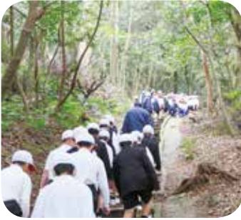
ペアを組んで杵崎神社へ

緊急地震速報が出たという放送のあと、ペアを組んだ子ども達、地域の方々も参加して、安全に移動し、災害予防について学びました。