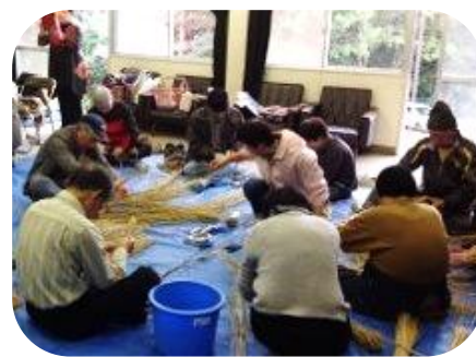
みんなと一緒に輪飾りづくり