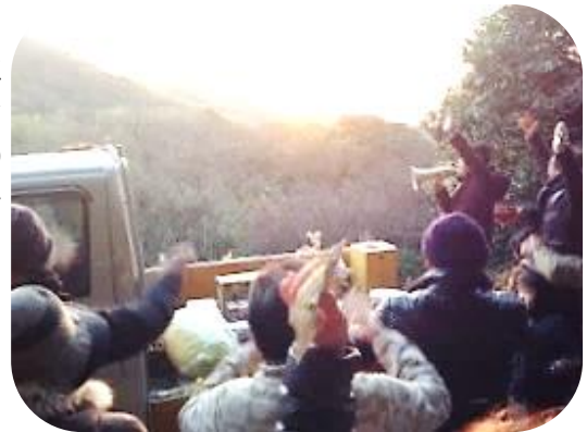
初日の出を万歳三唱で迎えましょう