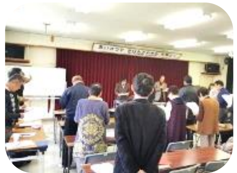
総会の初めに市民憲章を唱和