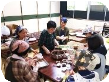
地域の方で料理を作りました