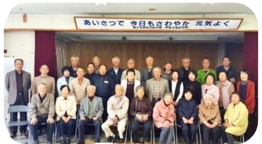
老人クラブの集合写真