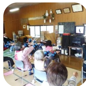
岩屋ニコニコサロン