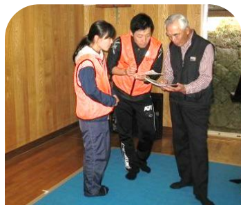
司会者と協働隊員が打合せ