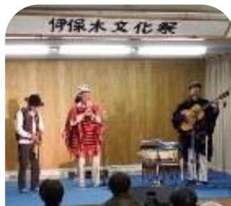
中南米の民族音楽を演奏