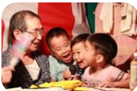
ほのぼのとした最優秀作品

文化祭と表彰式には、日刊新周南、Kビジョン、瀬戸内タイムスに加えて、今年はLucs（ルクス）の取材があり、紙面やブログで、その模様を紹介していただきました。なお、Kビジョンの放送は、年明けの予定です。