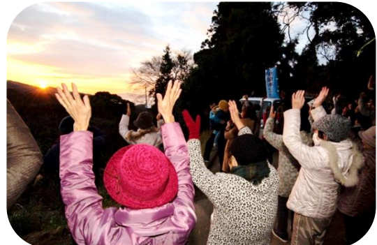
初日の出を万歳三唱で迎えましょう