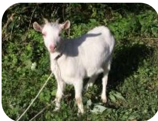
“さくら”で～す。みなさんよろしく！

日刊新周南や瀬戸内タイムスでも紹介されましたので、他の地域の方も時々会いに来ていただいています。