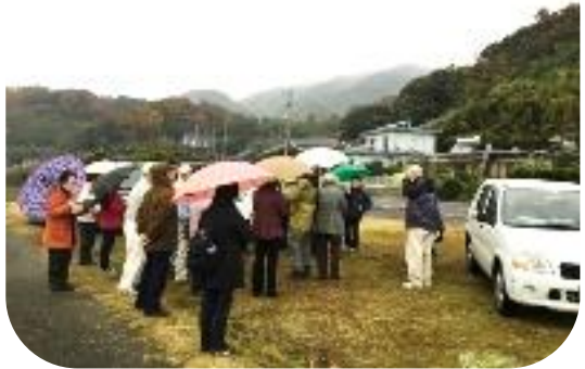
傘をさして、熱心に五軒屋を探訪

研究会から「職員をはじめ地域の方々には、プロジェクター投影や事前の草刈・清掃など、暖かいおもてなしをしていただきありがとうございました。山間地に負けないご先祖からのたくましい意欲を感じました。当地のご発展をお祈りします。」と謝辞をいただきました。