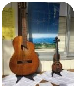
廃材で作ったギター

なお、作品の一部は当分の間展示してありますので、コミュニティセンターにお越しの際は、ぜひご覧ください。