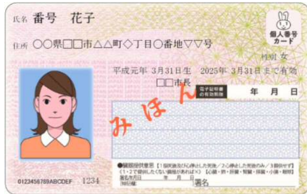
<マイナンバーカード(見本)>