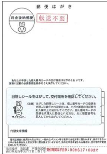
<交付通知書(はがき)>