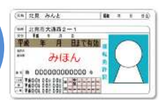
運転免許証 マイナンバーカード