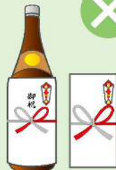
お祭りへの寄附・差し入れ、町 内会の集会・旅行などの催物 への寸志・飲食物の差し入れ

※政治家本人が結婚披露宴、葬式などに自ら出席してその場で行う場合には、罰則が適用されない場合があります。