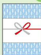
お歳暮・お年賀など