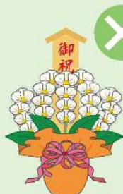
落成式・開店祝などの 祝花、葬儀の供花、病 気見舞いなど