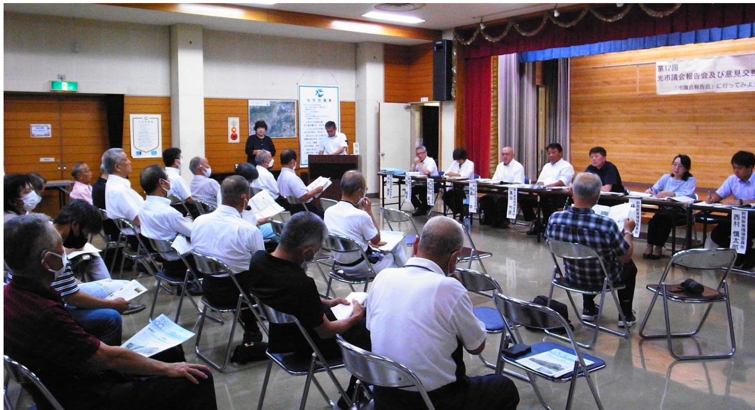
写真：第12回市議会報告会（令和5年度） 三島会場

市議会の活動全般について市民の皆様へ直接報告するとともに、意見交換を行い多様な意見をお聞きすることを目的として開催します。