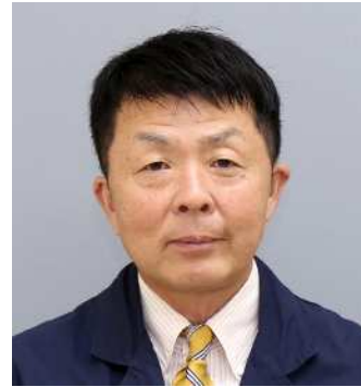
光市議会議長 森戸芳史

光市議会では、市民の安全・安心の確保と地域福祉や市民サービスの向上を図るため、議会改革及び議会活性化への取組の推進により、日々、議会力の向上に努めています。