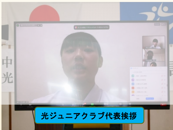
光ジュニアクラブ代表挨拶

（前省略）キーワードは「主体性」です。参加できる講座には、一人ひとりが主体的に、全力で取り組んでほしいと思います。何事も主体的に取り組む中ではじめて、得るものが生まれてくるからです。講座そのものは、新型コロナウイルス感染症の影響を受けるかもしれませんが、その中でも、何か学び取ってほしいと思いますし、さらに、講座で得た体験や考えた事から、学校生活や部活動、地域での行事の中で生かすことにより、一人ひとりの生活や人生がより豊かなものにしてほしいと思います。（以下省略）