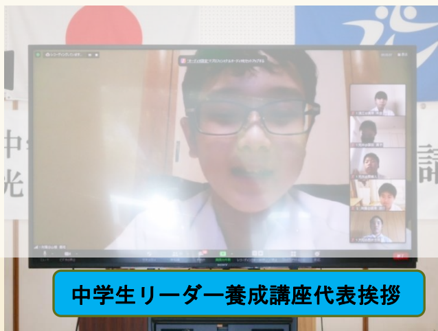
中学生リーダー養成講座代表挨拶

(前省略) この講座は、地域の行事のボランティアや、地域の人たちとの交流、さらに、会員同士のふれあいなど、たくさんの活動があり、楽しみにしています。いろいろな経験を積み、リーダーに必要なリーダーシップやスキルを磨きながら、たくさんの人たちとふれあいを深めていきたいと思っています。講座には、積極的に参加し、学びを自分の力に変えていきたいです。(以下省略)