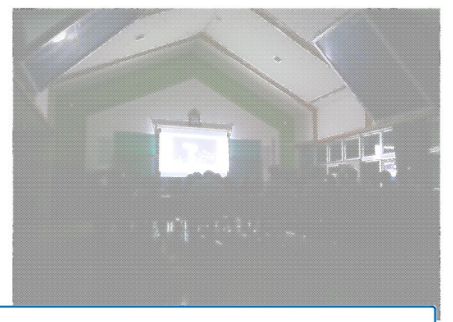
天候不良のため、星の話を聞きました