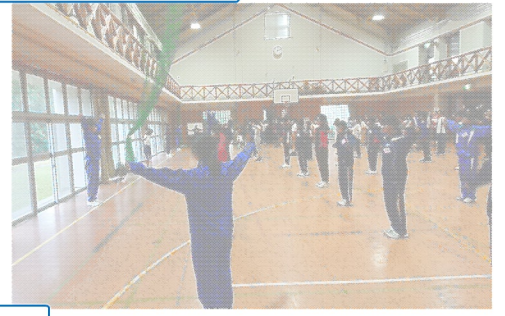
つといで活躍!! 他団体さんともゲームで交流しました