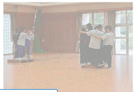
TAP研修 支え合いながら課題に挑戦しました。ふり返りもしっかり行いました