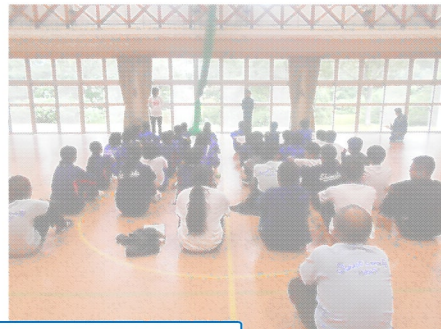
ふり返りをしてから退所式を行いました