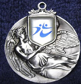
受賞者に授与されたメダル

受賞者は光市ホームページの光市記者発表2月3日「令和2年光市スポーツ優秀選手表彰について(体育課)」をご覧ください。