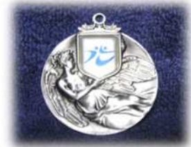
受賞者に授与されたメダル