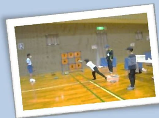
ディスクゲッター