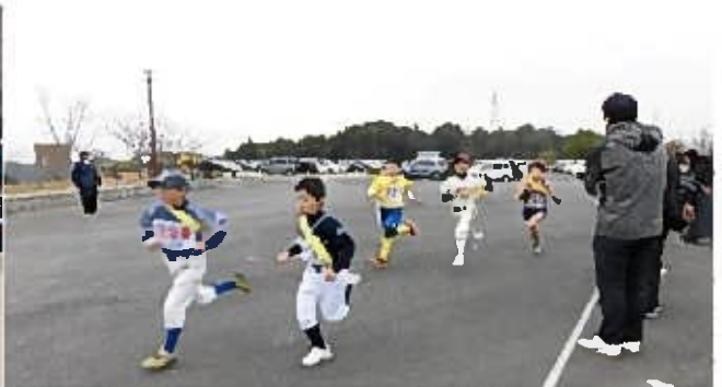
中間点付近を力走!