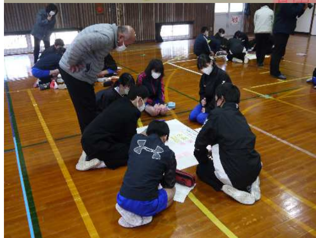
地域の方や大和中学校と各小学校の先生が、真剣に考える児童・生徒を見守りました。