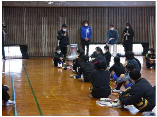
ふせんに書いた意見の中からベスト3を決めて、グループごとに発表しました。

このワークショップは、小学校6年生の中学校体験授業の一つとして行いました。 この日は他に小学生が中学校教諭の授業を受けたり、中学生と合同で体育の授業を受けたりしました。