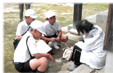
徘徊対応模擬訓練