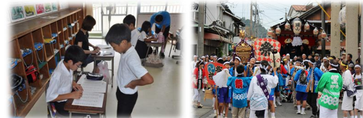
夏休みスキルアップ教室