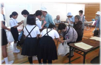
敬老のつどいボランティア