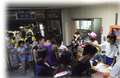
公民館夏祭りホラーハウス