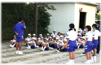
中学生との陸上練習