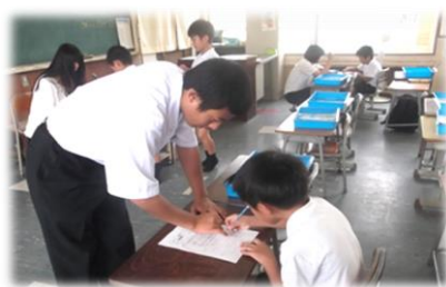
夏休みスキルアップ教室