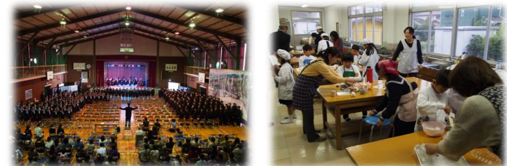
中学校文化祭での小中合同合唱