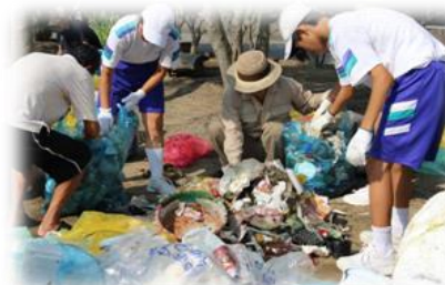
クリーン光大作戦