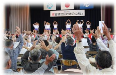
室積地区敬老のつどい