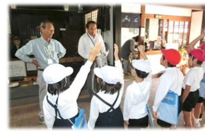
室積ふれあいインタビュー