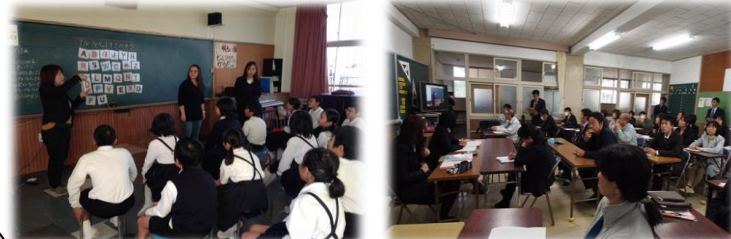
小中教員TTによる外国語活動