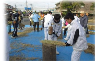
正月準備のわら打ち