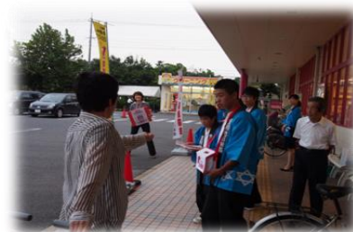
赤い羽根共同募金