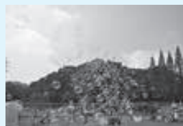
しゃぼん玉ショー @miffy2435