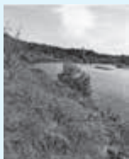
島田川沿いの彼岸花 @ume20928