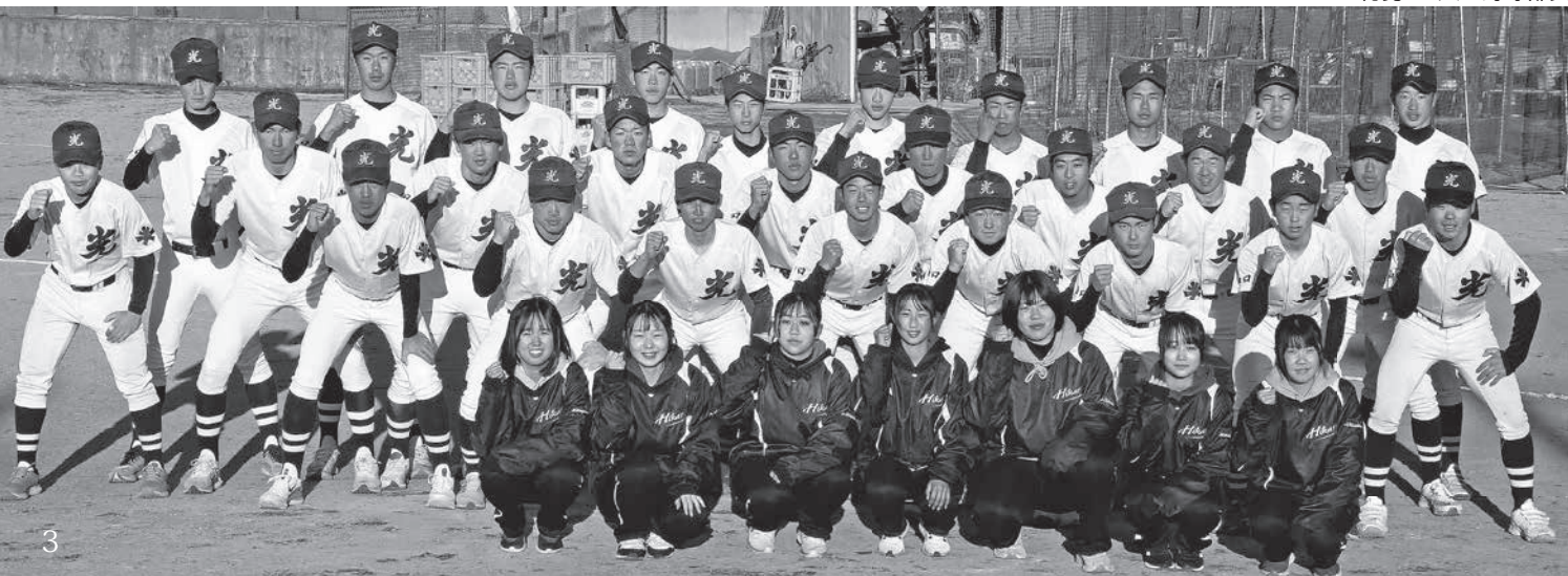
▼総勢 34 人の野球部員