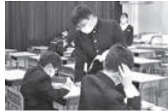
▲放課後学習会の様子

光高校では「質実剛健」「自主創造」の校訓の下、地域とともに歩む学校を目指しています。中学校に生徒が出向く放課後学習会や全校生徒による市内清掃活動のほか、野球部員による自発的な校外清掃など、まちの一員として地域と調和のとれた取り組みを行っています。