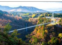
日本の滝百選 震動の滝 大分県九重町