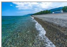
日本の渚・百選 宮崎・境海岸 (ヒスイ海岸) 富山県朝日町