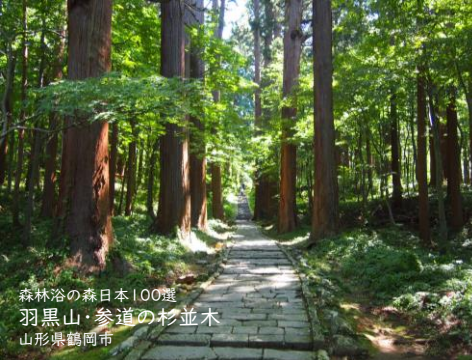
森林浴の森日本100選 羽黒山・参道の杉並木 山形県鶴岡市