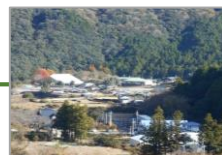
森林浴の森日本100選 高田の里 和歌山県新宮市