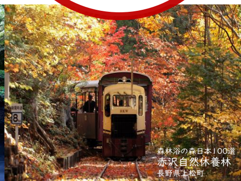
森林浴の森日本100選 赤沢自然休養林 長野県上松町