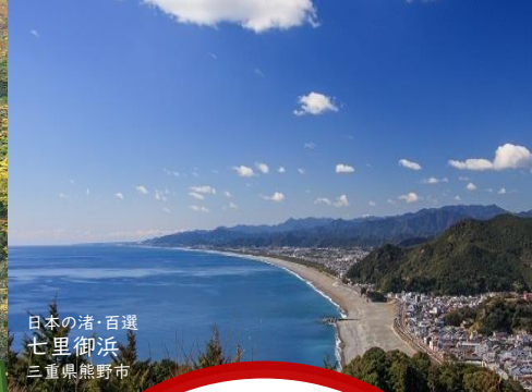
日本の渚・百選 七里御浜 三重県熊野市