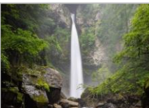
日本の滝百選 根尾の滝 岐阜県下呂市