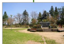
森林浴の森日本100選 城山公園 岐阜県高山市