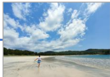
日本の渚・百選 弓ヶ浜海岸 静岡県南伊豆町