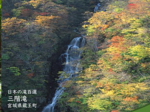
日本の滝百選 三階滝 宮城県蔵王町