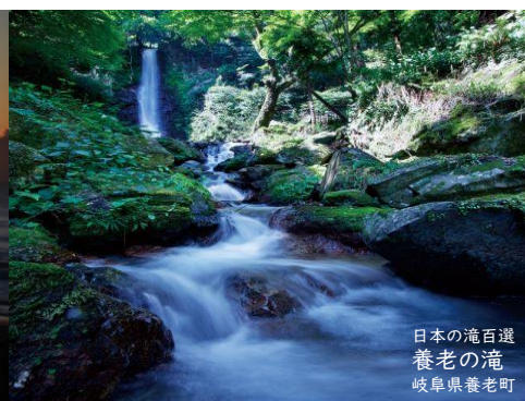
日本の滝百選 養老の滝 岐阜県養老町