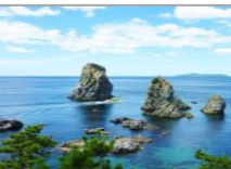
日本の渚・百選 青海島 山口県長門市