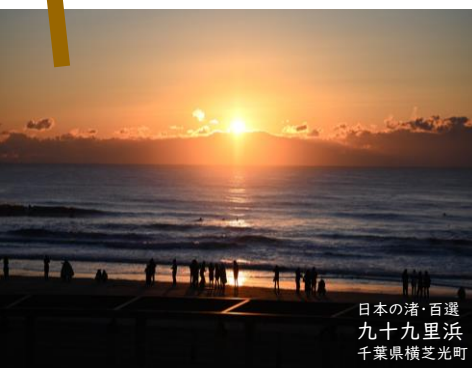
日本の渚・百選 九十九里浜 千葉県横芝光町

雄大な自然を堪能できる デジタルスタンプラリー 「御朱印ラリー」を 開催します！ ぜひご参加ください！