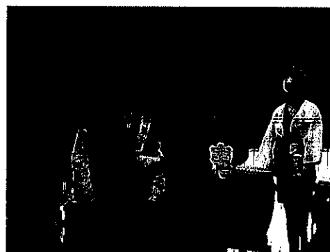
昨年度の学習発表会・石城太鼓引継式の様子