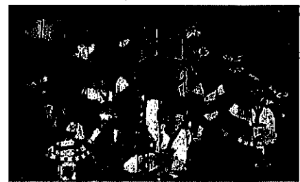
現在のレリーフ（修復前）