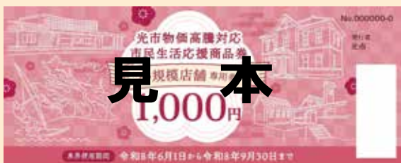
小規模店舗専用券