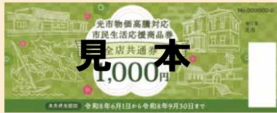
共通券 (全ての取扱店で使用可)