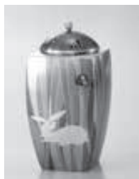
きりばめぞうがんはぎあわ 切嵌象嵌接合せ香炉 「草叢」