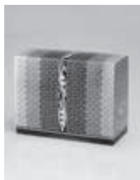
きりばめぞうがんはぎあわ 切嵌象嵌接合せ箱 「春光」