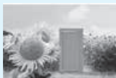
小周防のひまわり @nana_777888