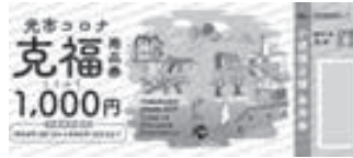
▲小規模店舗専用券見本(青色)