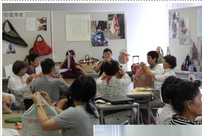
実演をする参加者