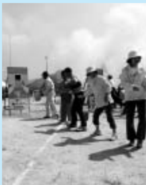
大和中学校で開催された総合防災訓練の様子 (バケツリレーで消火訓練)

7月に県内を襲った集中豪雨の被害で、私たちは、災害はいつどこで発生するのか予測が難しい事を改めて思い知らされました。近年の災害の特徴は、被災範囲が広く、行政だけで市内全域をカバーすることが困難なため、市民の皆さん自身が、防災への知識や意識を持つことが大切になります。市では、8月19日(木)に大和中学校で、「総合防災訓練」を実施し、20日(木)には、「防災センター」で子ども特派員の児童たちが体験型の講習を受けるなど、突然の災害にどのように対応すべきか学びました。9月は台風などの災害が懸念されるシーズンです。大切な家族を守るため、ご家族で危険箇所のチェックや、非常持ち出し品の準備など、しっかりと話し合ってみてはいかがでしょうか。