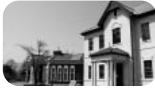
伊藤公資料館を取材して